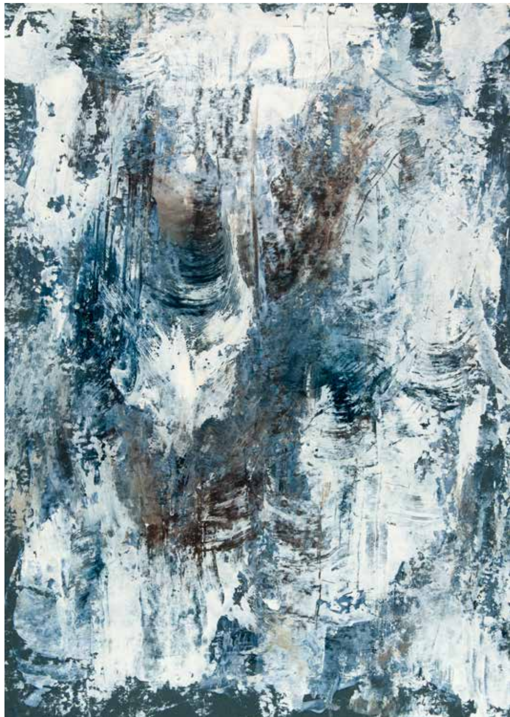
Senza Titolo tecnica mista olio - acrilico su tela 50 x 70 cm