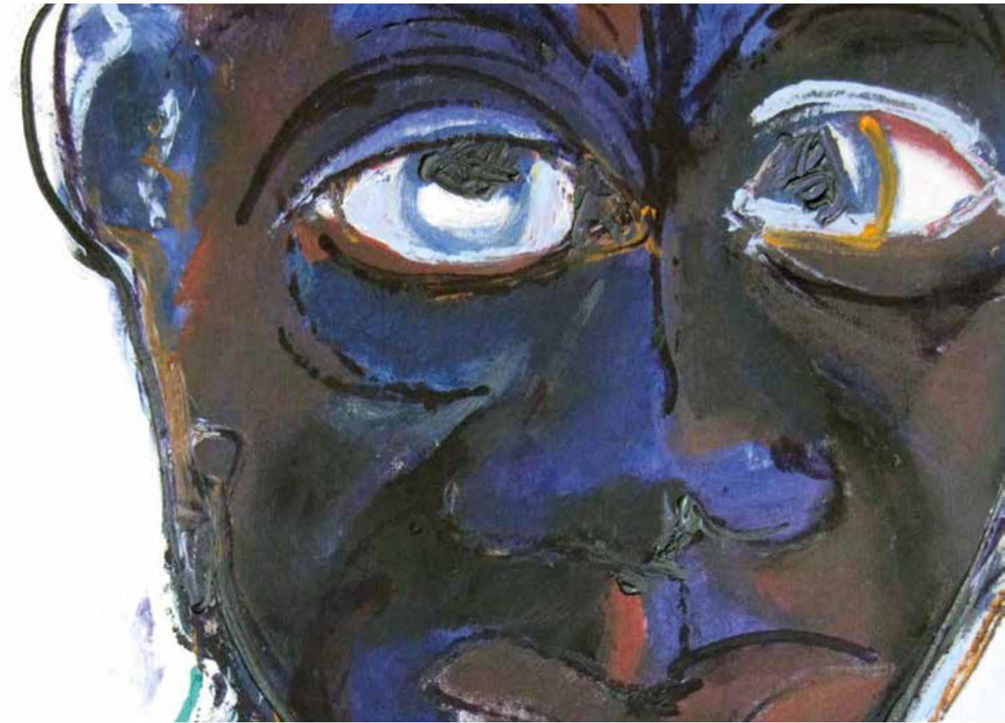
No racism (particolare) Acrilico su tela 95 x 100 cm

"E' un viaggio che inizia sempre con una tela bianca che si riempie di colore di forme di immagini."