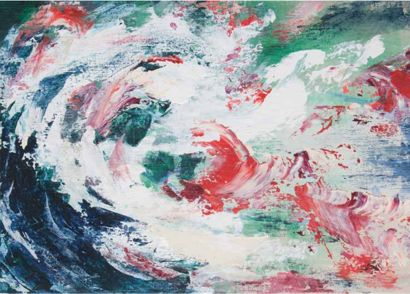
Senza Titolo tecnica mista olio - acrilico su tela 50 x 70 cm