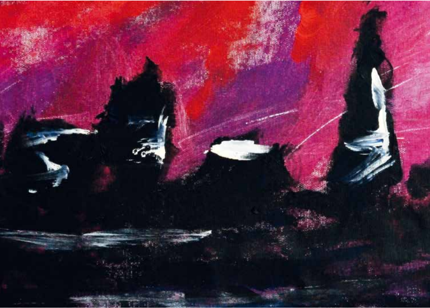
Sky Line (particolare) Acrilico su Tela 52,5 x 28 cm

“Con la pittura cerco di esprimere le mie sensazioni e la mia personalità”