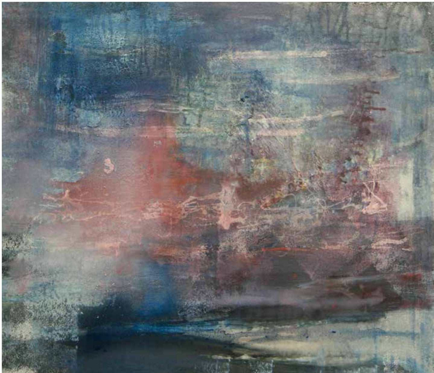
Oceano mare acrilico su tela 90 x 100 cm