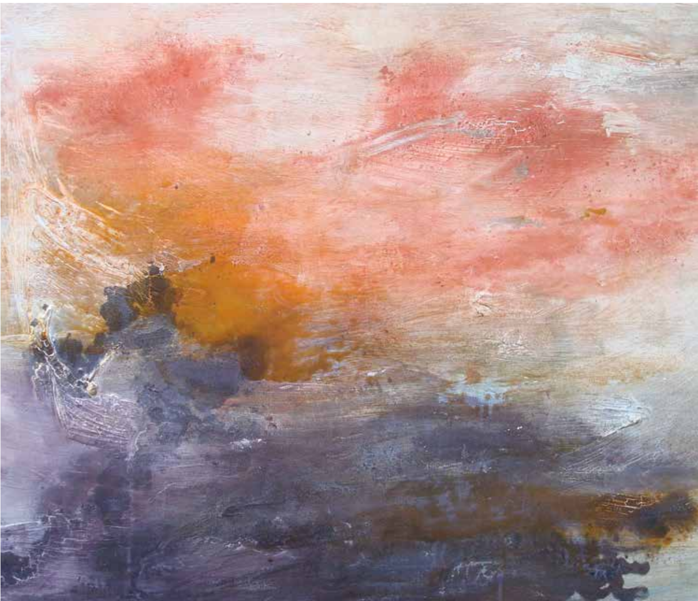
L'ennui et l'idéal acrilico su tela 80 x 100 cm