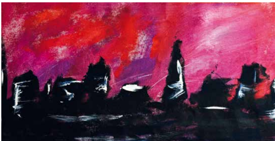
Sky Line Acrilico su Tela 52,5 x 28 cm