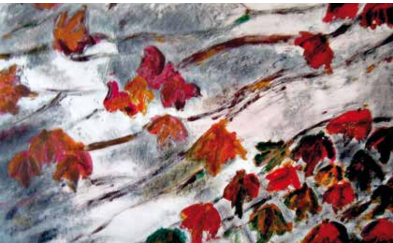
Fondale Acrilico su tela 40 x 32 cm