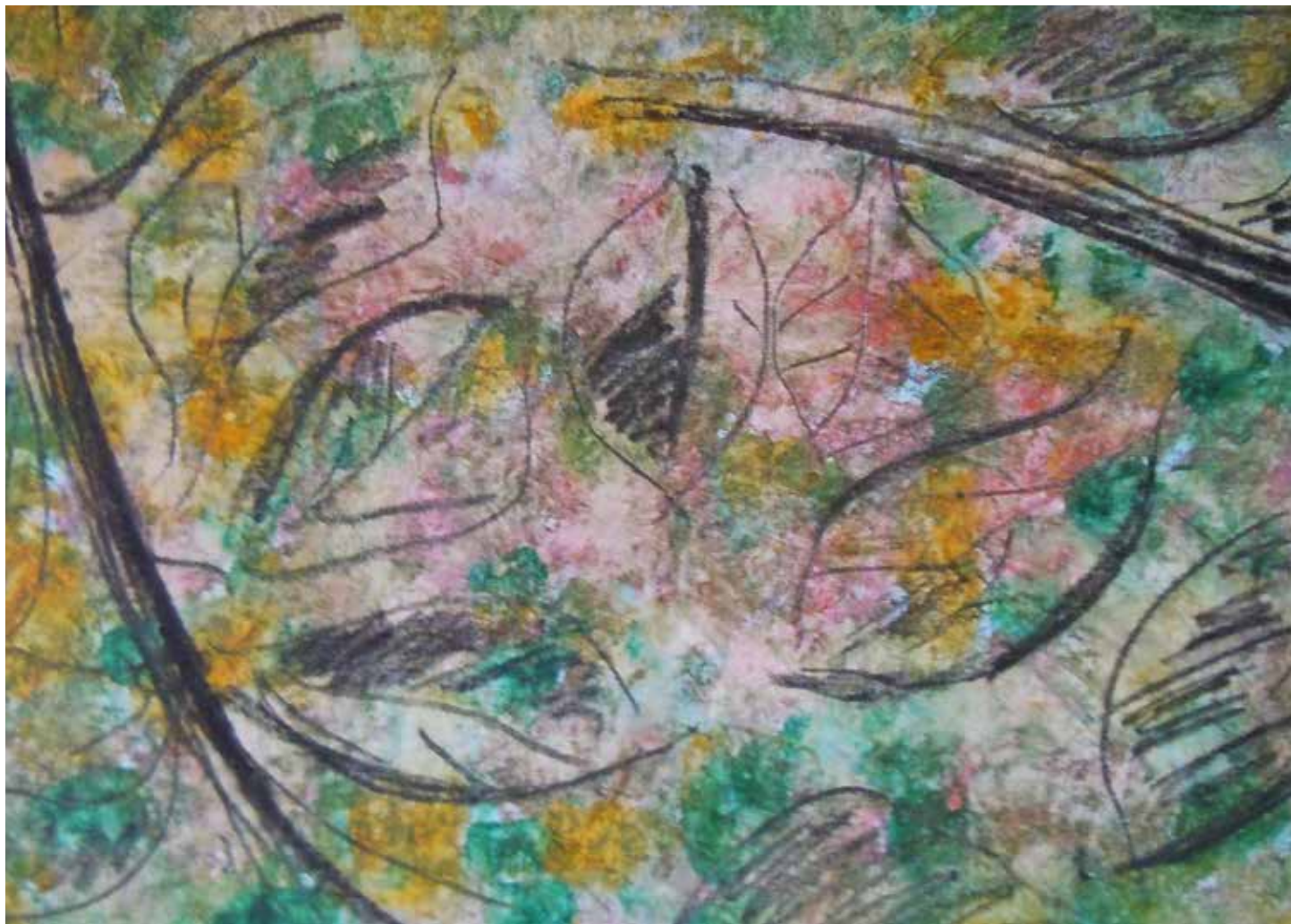
Primavera tecnica mista su tela 41 x 72 cm