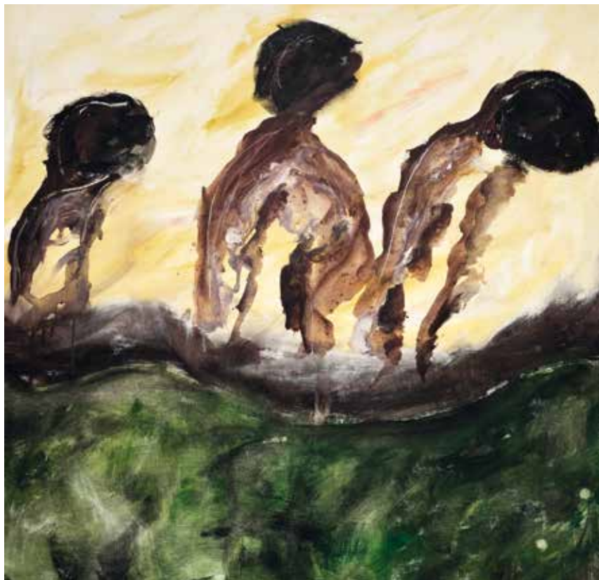
Pensatori Acrilico su Tela 86 x 81 cm