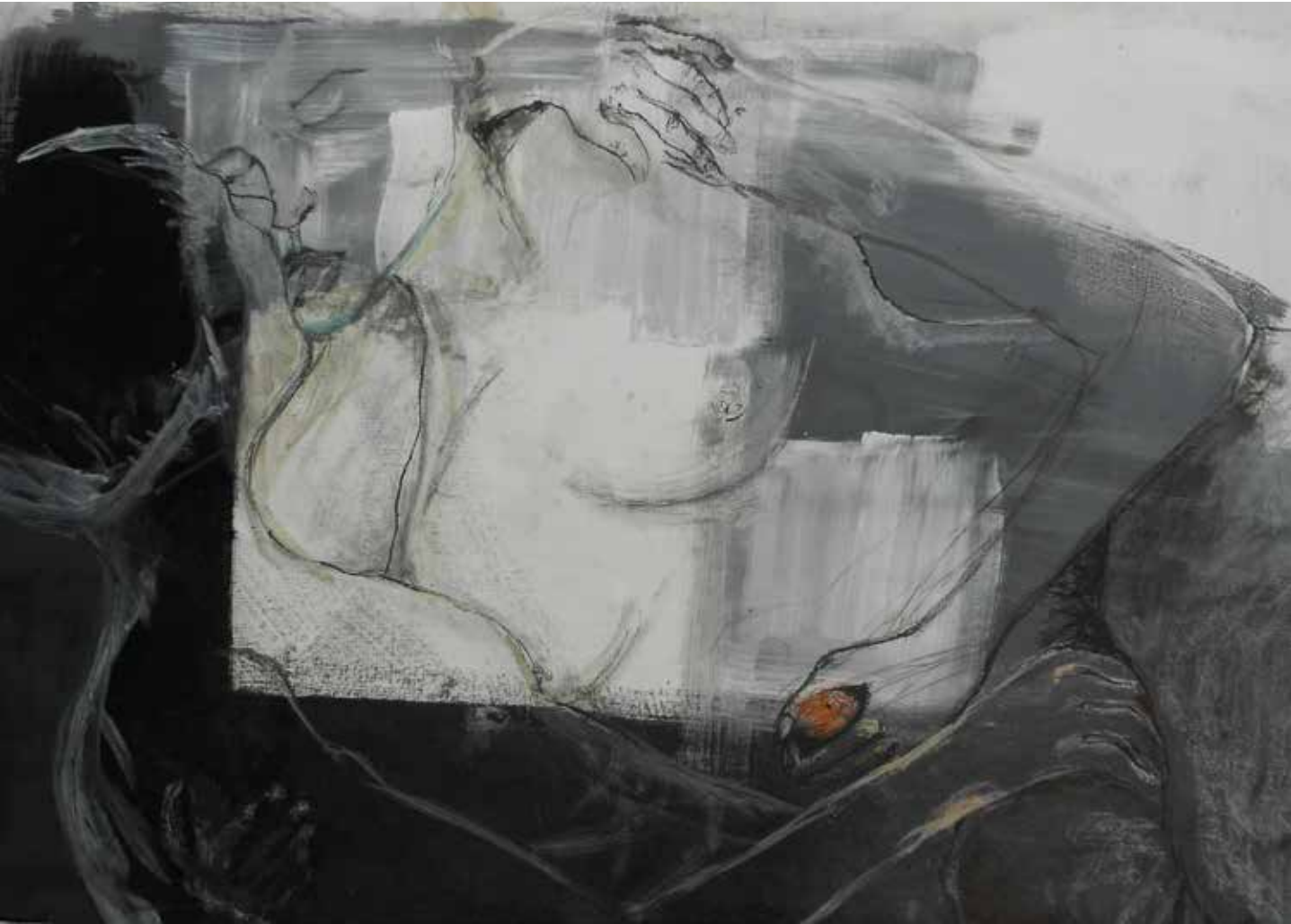
Bacio Tecnica mista 70 x 90 cm

“Sono partita dal corpo che ho rappresentato in modo materico, Cerco un contatto quasi fisico tra me, la tela e il colore”