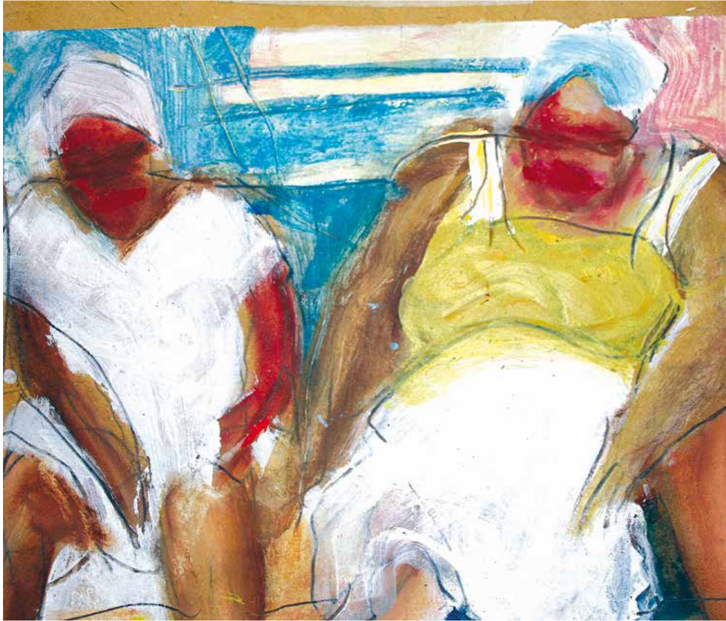
Las mamás de Cuba Tecnica mista su carta