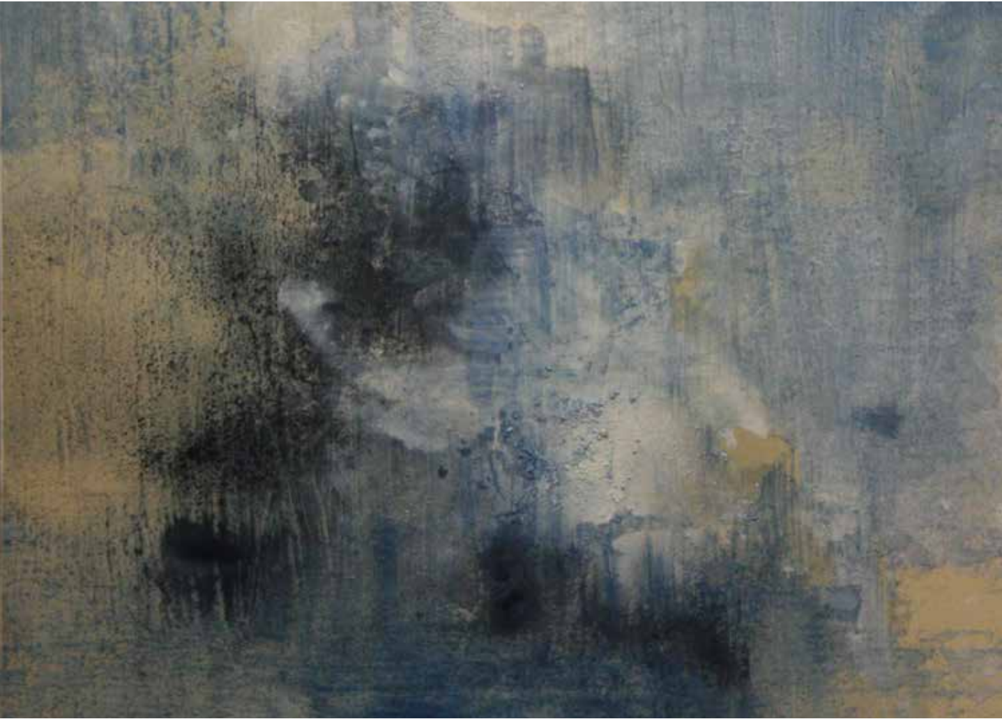
Oltre l'oscurità acrilico su tela 80 x 80 cm