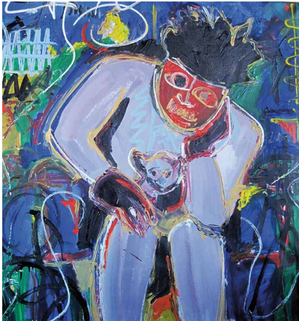
Pensieri Acrilico su tela 95 x 100 cm