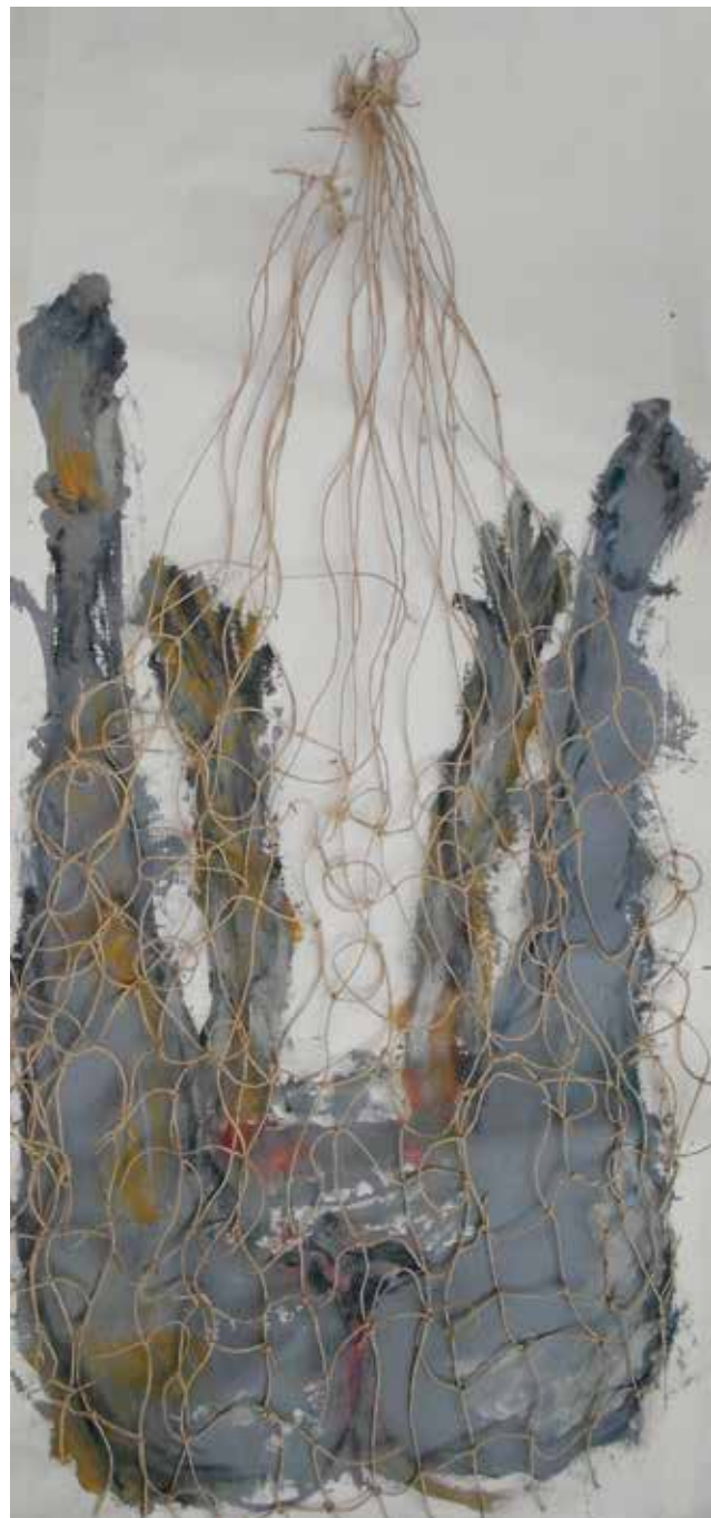
Rete Tecnica mista 50 x 90 cm