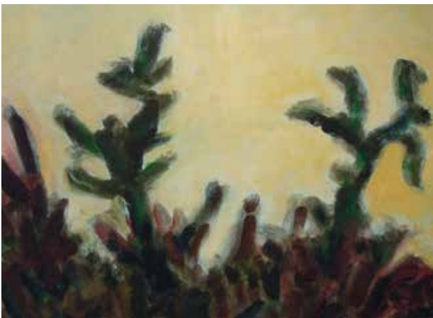
Paesaggio Toscano acrilico su tela 40 x 60 cm