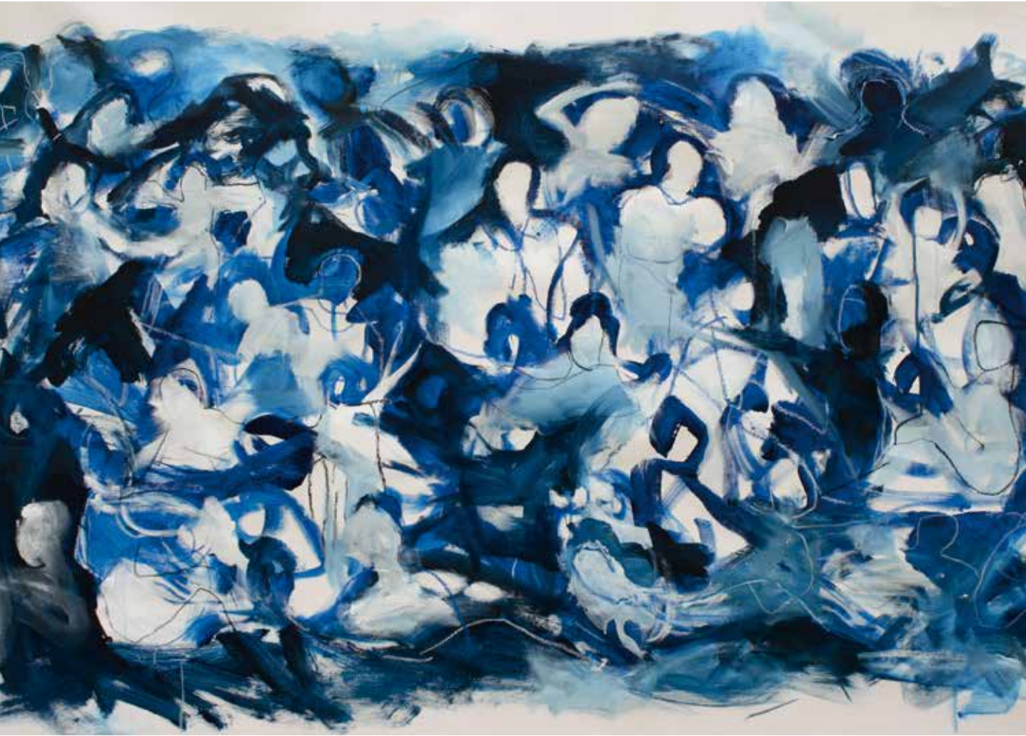
Folla blu acrilico olio e pastello su tela 188 x 113 cm

"Mi muovo rapidamente precedendo e anticipando il pensiero."