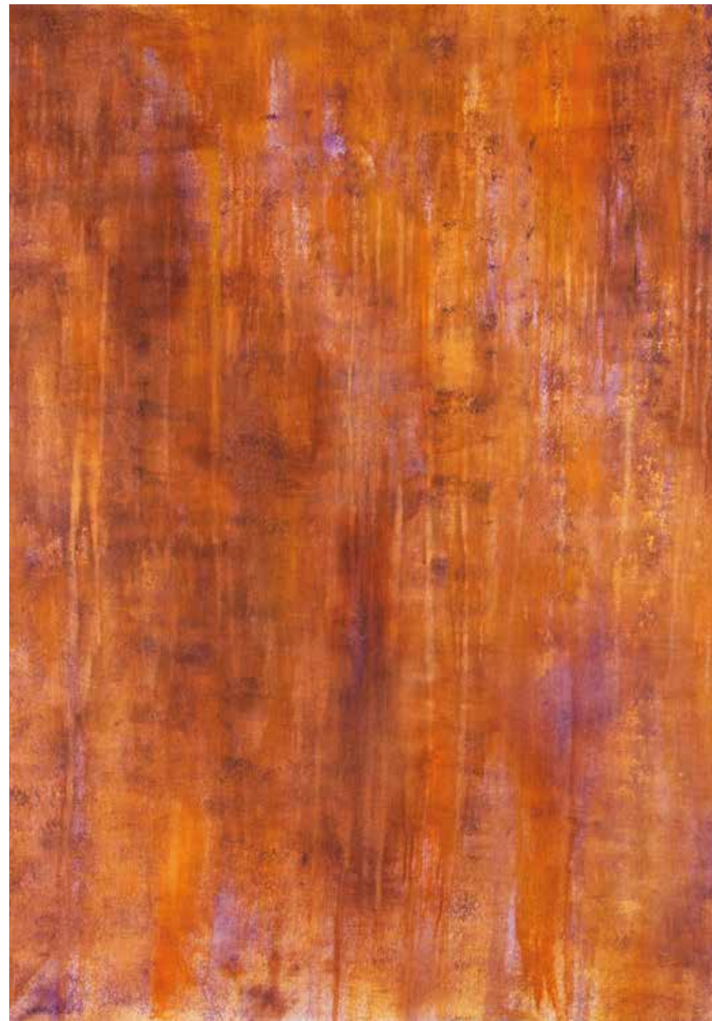
Senza Titolo tecnica mista olio - acrilico su tela 80 x 100 cm