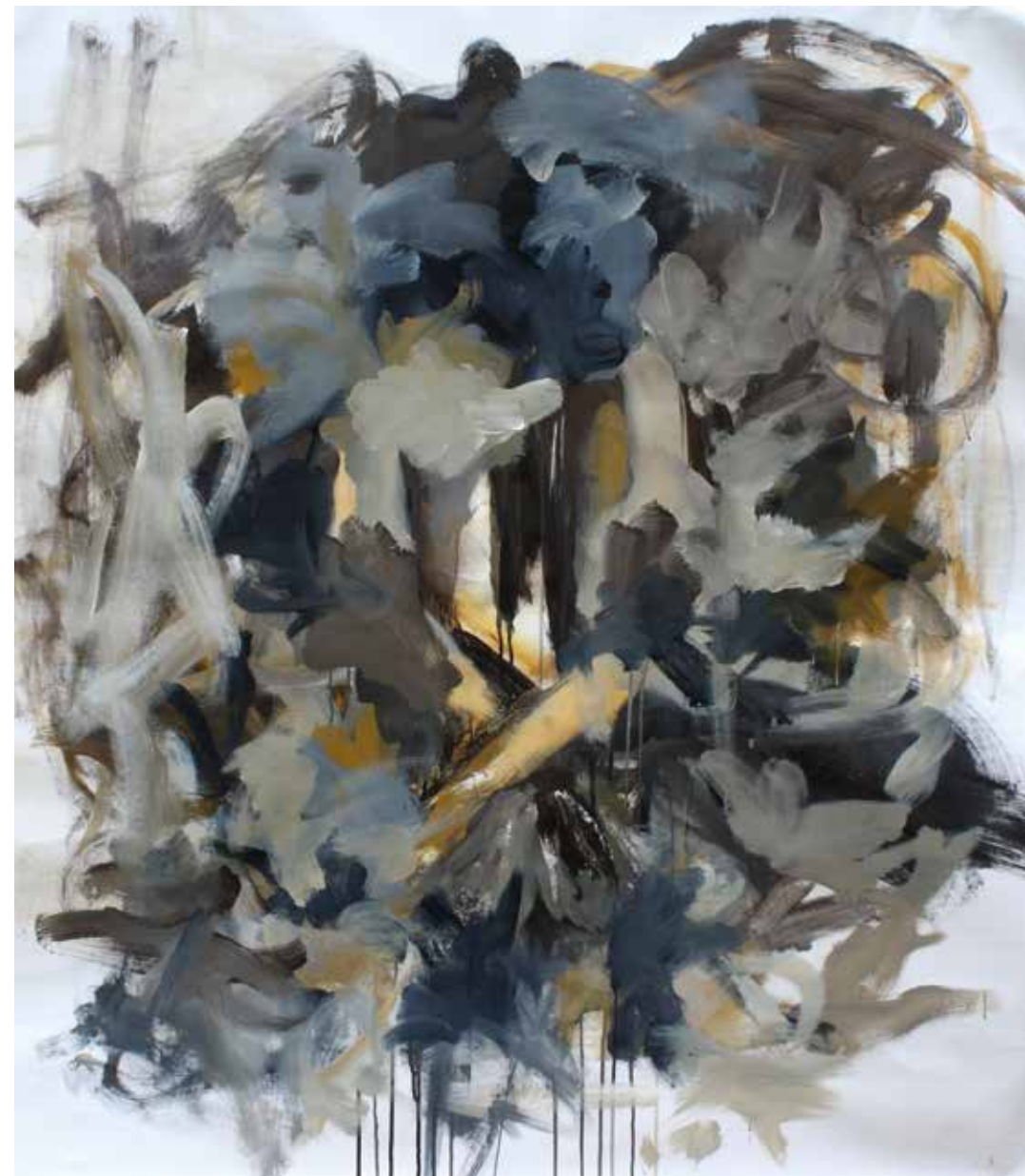
Il pianeta delle scimmie olio e acrilico su tela 125 x 150 cm