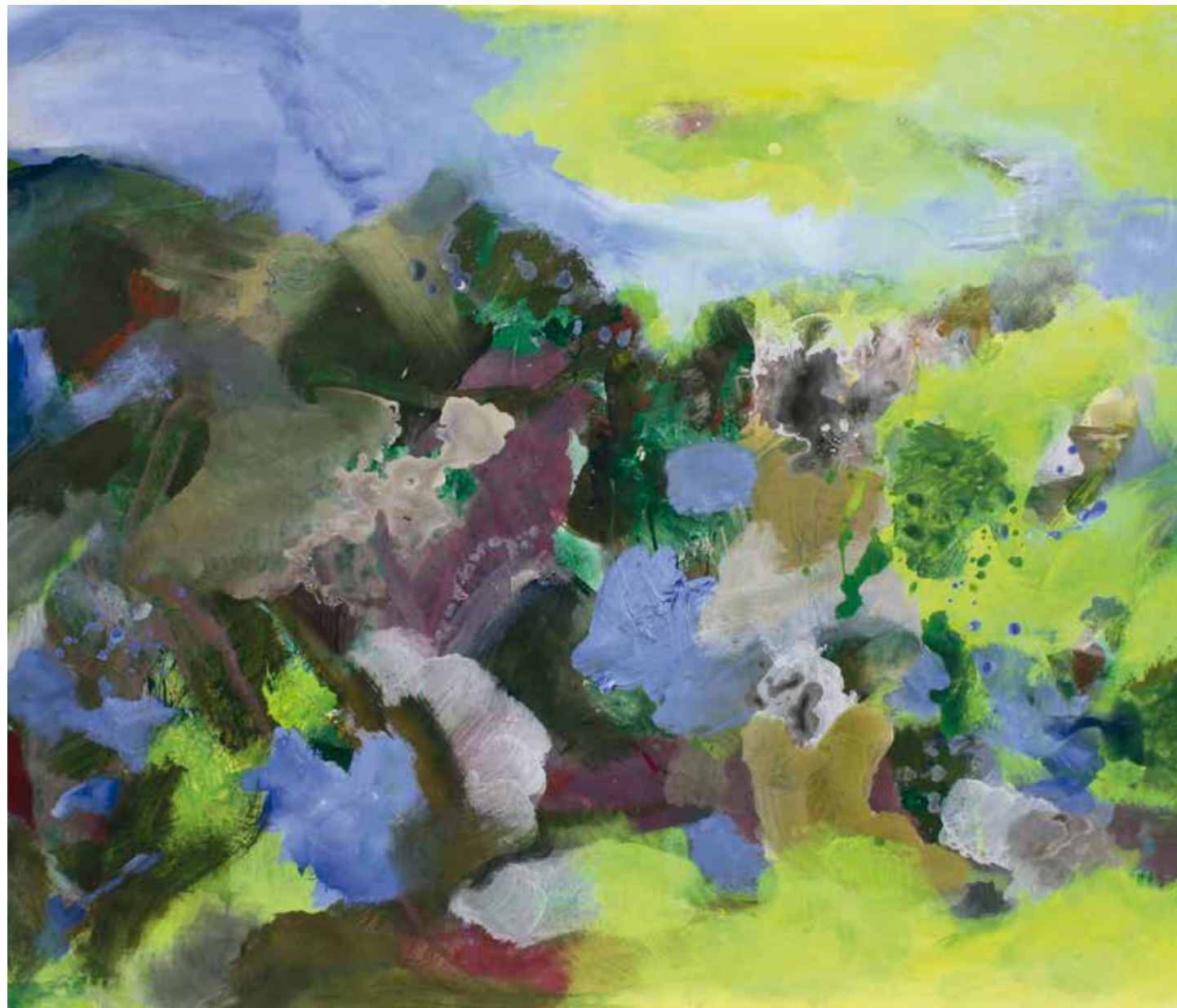
Nuovo giorno acrilico e olio su tela 145 x 110 cm