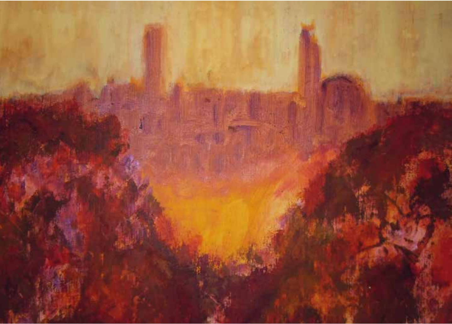
Paesaggio Toscano acrilico su tela 36 x 44,5 cm

“La cosa più bella è poter riprodurre con la pittura ed i colori le sensazioni e le emozioni”