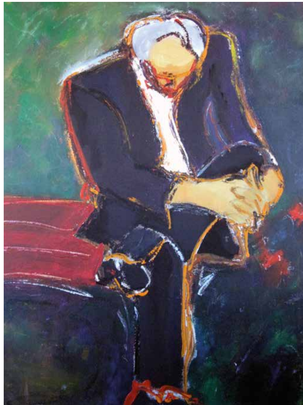
Solitudine Acrilico su tela 75 x 100 cm