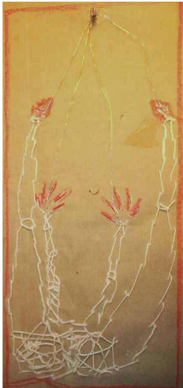
Ricamo Tecnica mista 40 x 60 cm