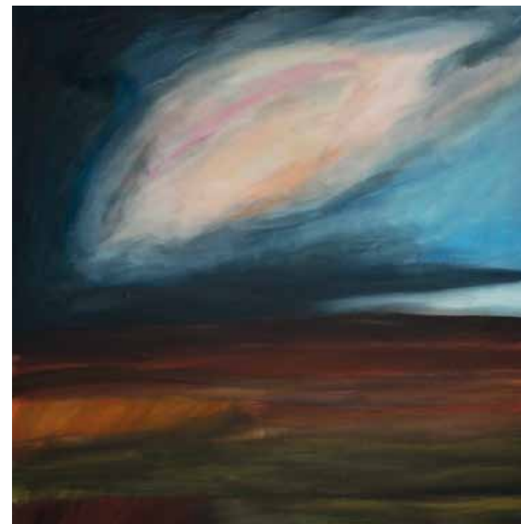
Lo spazio Acrilico su Tela 106 x 104 cm