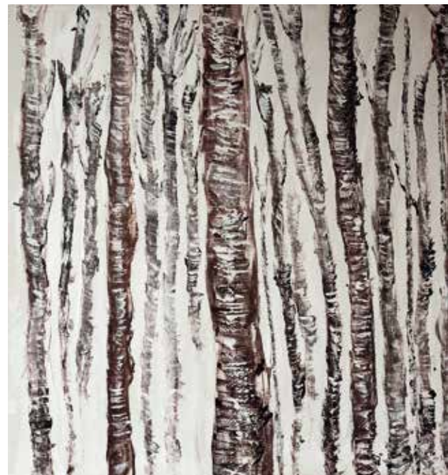
Alberi Acrilico su Tela 56 x 59 cm