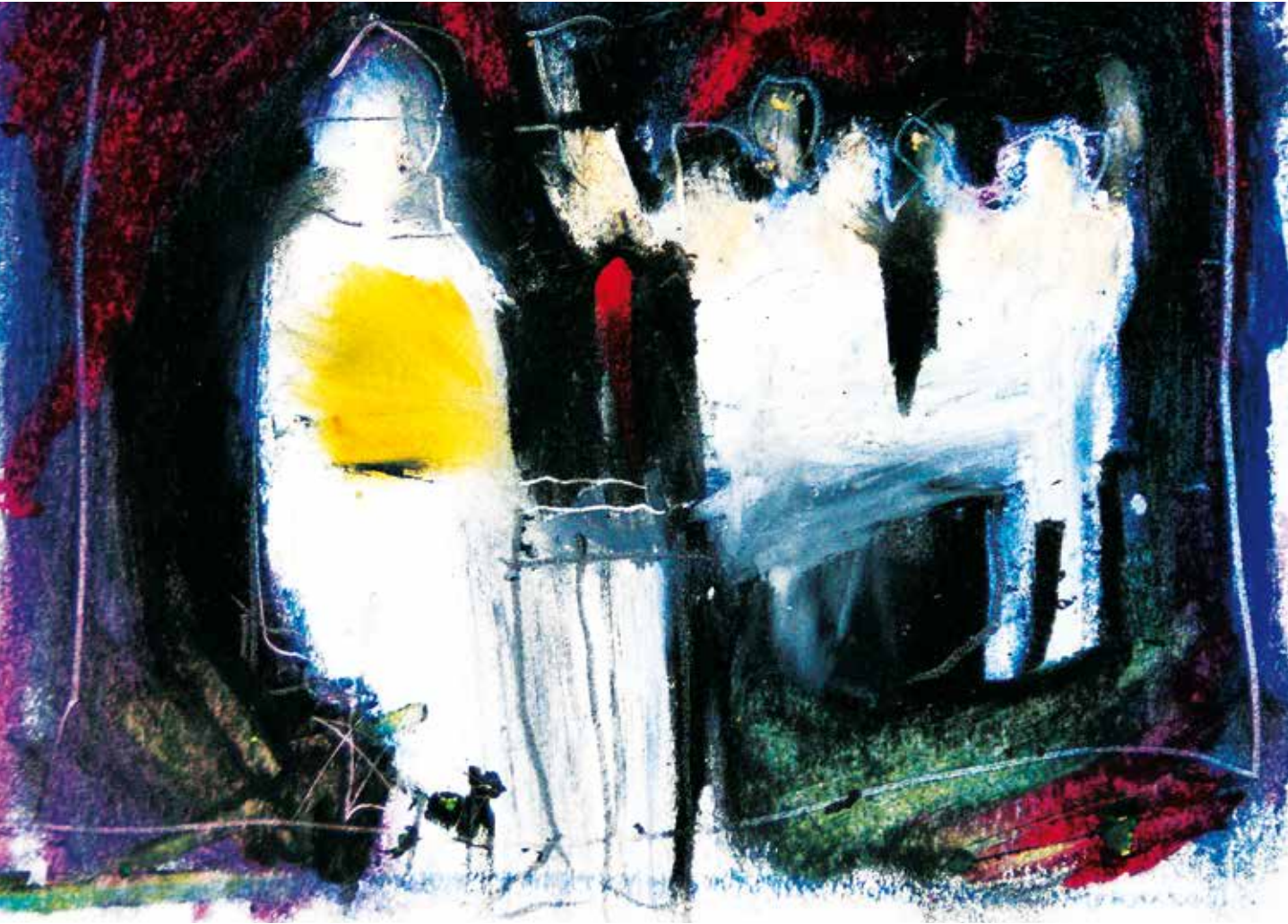
Finché morte non ci separi Tecnica mista su carta