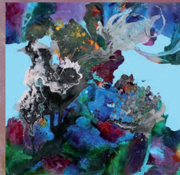
L'ISOLA CHE NON C'È, cm 70x70, olio e acrilico su tela, 2014