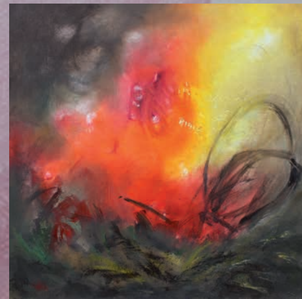
ULTIMO RAGGIO DI SOLE, cm 80x80, olio e acrilico su tela, 2011