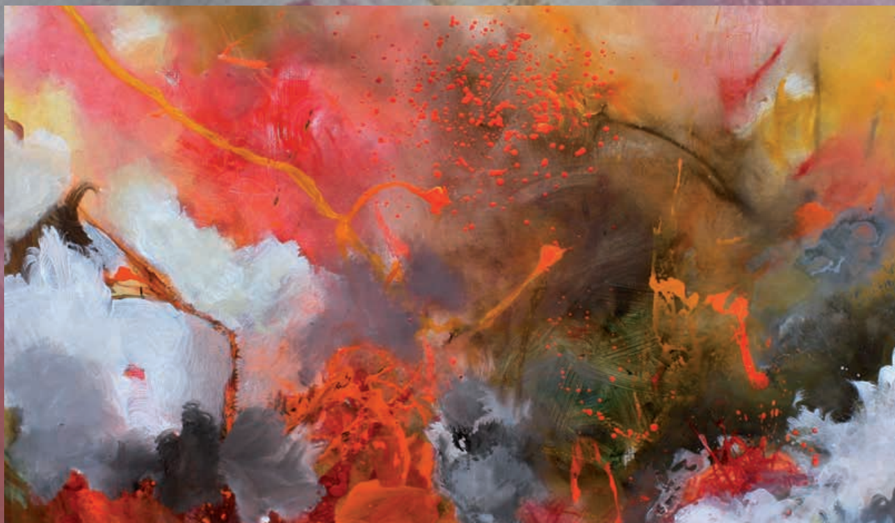
FLOWER POWER (particolare), cm 140x120, olio e acrilico su tela, 2013