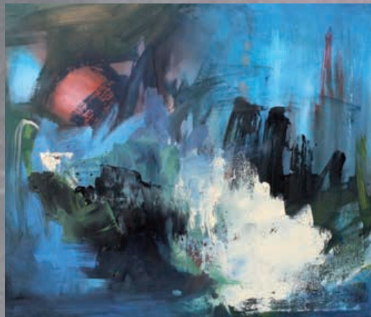
LET'S GET LOST, cm 90x70, olio e acrilico su tela, 2013