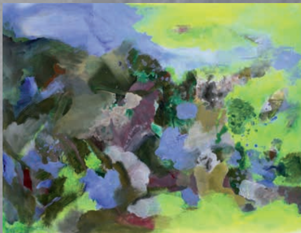
NUOVO GIORNO, cm 145x110, olio e acrilico su tela, 2013