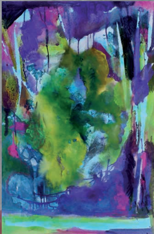
PSICHEDELIA, cm 95x145, olio e acrilico su tela, 2013

cmargadonna@gmail.com - www.claudiamargadonna.com